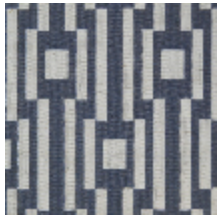
0615-01 OSIER - ARDOISE