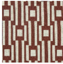
0615-04 OSIER - LAQUE