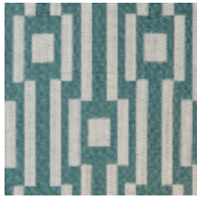
0615-02 OSIER - CELADON