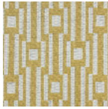
0615-03 OSIER - GENET