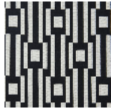
0615-06 OSIER - PAVOT