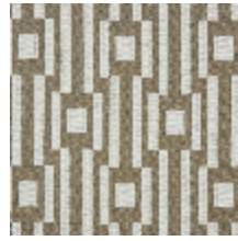
0615-05 OSIER - SISAL