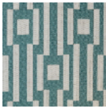
0615-02 OSIER - CELADON