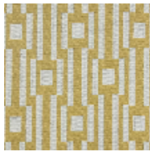
0615-03 OSIER - GENET