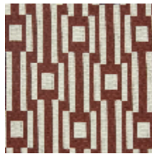
0615-04 OSIER - LAQUE