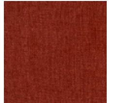
0616-36 SMART - CORNALINE