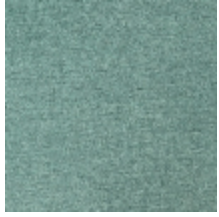
0616-01 SMART - LAGON