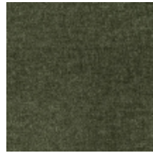
0616-17 SMART - PIN