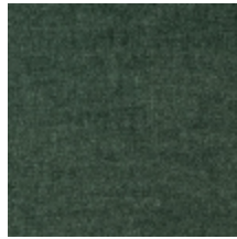
0616-16 SMART - CEDRE