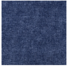
0616-07 SMART - INDIGO