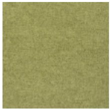
0616-19 SMART - PRAIRIE