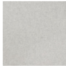
0616-23 SMART - PERLE