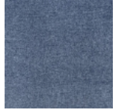
0616-06 SMART - MARIN