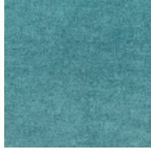
0616-03 SMART - TURQUOISE