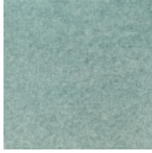
0616-02 SMART - AQUA