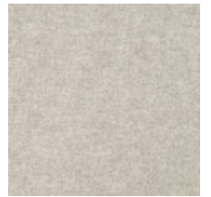
0616-24 SMART - FICELLE