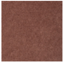
0616-13 SMART - AUTOMNE