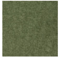
0616-18 SMART - ALOES