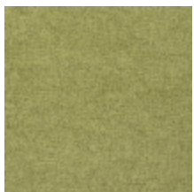
0616-19 SMART - PRAIRIE