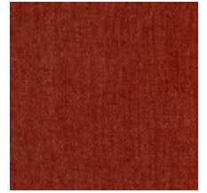
0616-36 SMART - CORNALINE