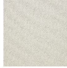
0626-05 SHERPAS - CRAIE