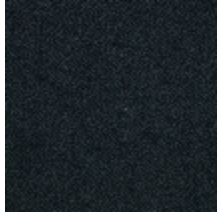
0626-01 SHERPAS - CANARD