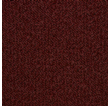
0626-02 SHERPAS - SIENNE