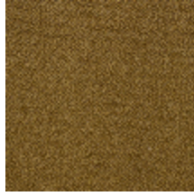
0626-03 SHERPAS - MOUTARDE