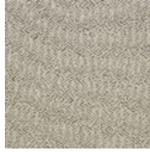
0626-04 SHERPAS - DUNE