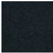
0626-01 SHERPAS - CANARD