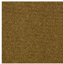
0626-03 SHERPAS - MOUTARDE