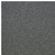
0633-13 WOOLY - ETAIN