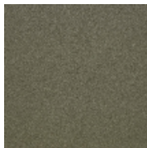
0633-21 WOOLY - TAUPE