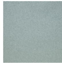
0633-11 WOOLY - CELADON