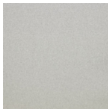
0633-15 WOOLY - GALET