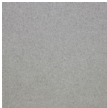
0633-14 WOOLY - SOURIS