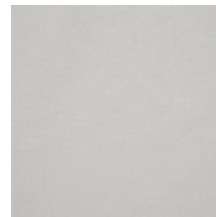
0633-17 WOOLY - CRAIE