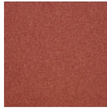
0633-04 WOOLY - SANGUINE