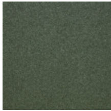
0633-01 WOOLY - FORET