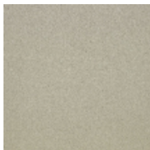
0633-20 WOOLY - FICELLE