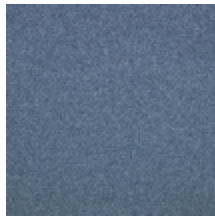
0633-09 WOOLY - DENIM