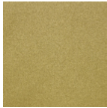
0633-03 WOOLY - TILLEUL