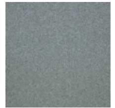
0633-12 WOOLY - CENDRE