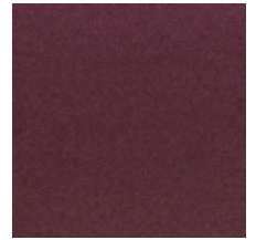
0633-06 WOOLY - FIGUE