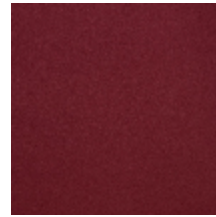
0633-05 WOOLY - RUBIS