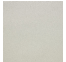
0633-18 WOOLY - DUNE