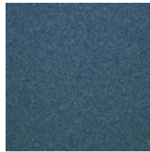
0633-10 WOOLY - PETROLE