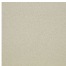
0633-19 WOOLY - SABLE