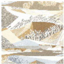
0635-01 ALTITUDE - GLACIER