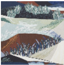
0635-02 ALTITUDE - CRÉPUSCULE