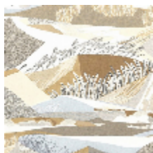
0635-01 ALTITUDE - GLACIER