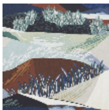
0635-02 ALTITUDE - CRÉPUSCULE