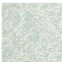
0637-04 GRAMINAE – CELADON *