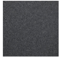
0638-06 TAÏGA - CHARTREUX