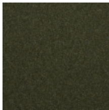
0638-14 TAÏGA - FORÊT