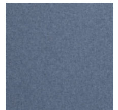
0638-18 TAÏGA - AZUR