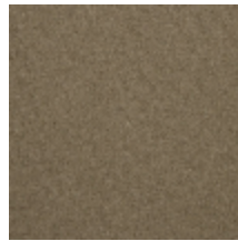
0638-10 TAÏGA - CHAMOIS