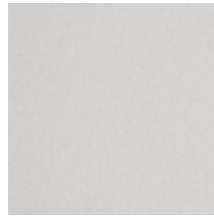
0638-04 TAÏGA - PERLE