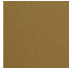
0638-12 TAÏGA - BLÉ