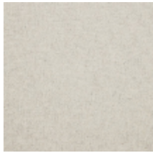
0638-01 TAÏGA - NATUREL