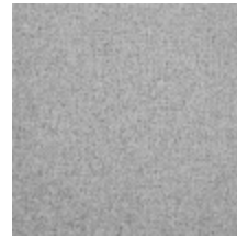
0638-05 TAÏGA - BRUME