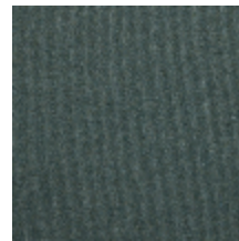
0638-17 TAÏGA - SAUGE