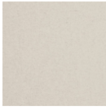
0638-02 TAÏGA - ECRU