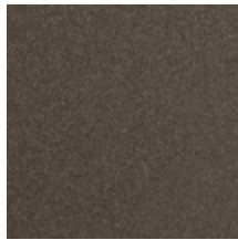
0638-09 TAÏGA - OURS