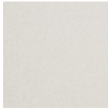
0638-03 TAÏGA - NEIGE