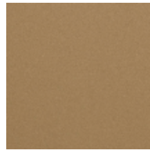
0638-11 TAÏGA - CAMEL