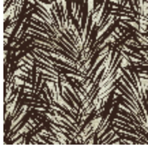
6442-01 PALMERAIE BRONZE *