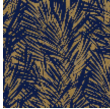
6442-03 PALMERAIE COBALT *