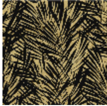
6442-02 PALMERAIE ART DECO *