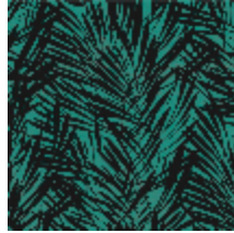
6442-04 PALMERAIE PAON *