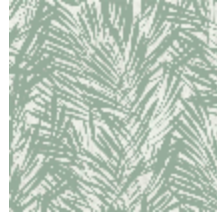
6442-05 PALMERAIE CELADON *