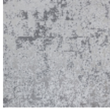
6447-03 PATINE ARGENT