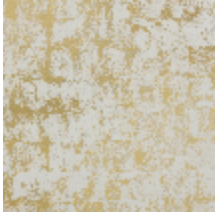
6447-01 PATINE VERMEIL