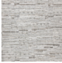
6448-02 RABANE NUAGE