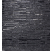
6448-04 RABANE CHARBON