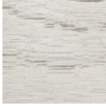
6448-01 RABANE NATUREL