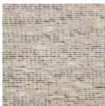
6458-01 ONDULATION - GREGE