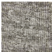
6458-03 ONDULATION - FUMÉE