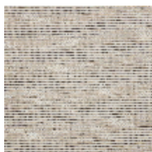
6458-01 ONDULATION - GREGE