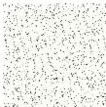
6462-01 RESSEMBLANCE - IVOIRE/NOIR