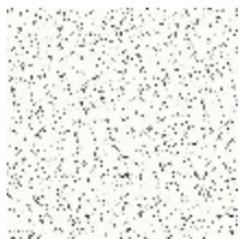
6462-01 RESSEMBLANCE - IVOIRE/NOIR