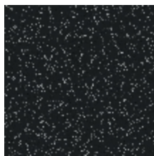
6462-03 RESSEMBLANCE - ARDOISE