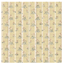
6497-01 MADemoiselle - PAILLE