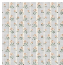
6497-04 MADemoiselle - BLEUET