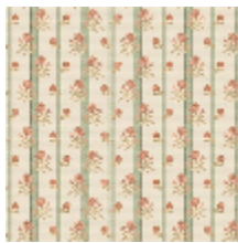
6497-02 MADemoiselle - PRINTEMPS