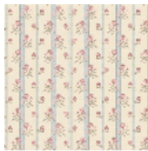
6497-03 MADemoiselle - PORCELAINE