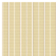
6498-01 RAYURE MLE - PAILLE