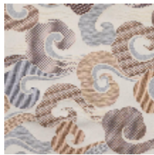
0651-03 ALIZE - NUAGE