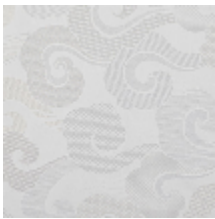
0651-01 ALIZE - ECUME