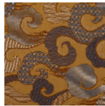
0651-05 ALIZE - AMBRE