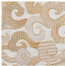
0651-02 ALIZE - SABLE