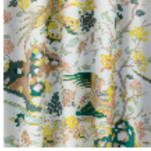
0653-01 LES SONGES - POUDRE