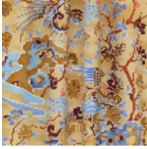
0653-02 LES SONGES - MIEL