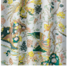
0653-01 LES SONGES - POUDRE