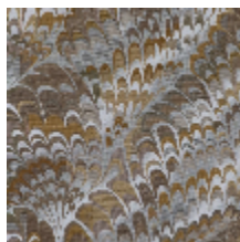
0654-03 DIVIN - NATUREL