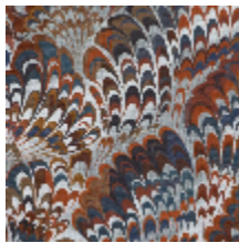
0654-02 DIVIN - INDIGO