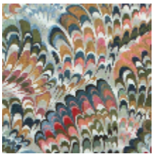
0654-01 DIVIN - CELADON