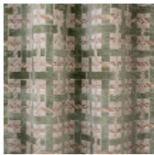
0655-01 LACIS - CELADON