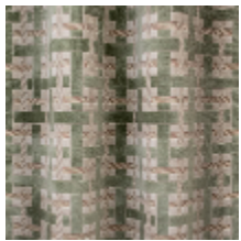
0655-01 LACIS - CELADON