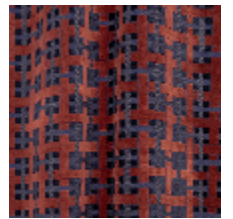
0655-06 LACIS - ACAJOU