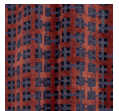
0655-06 LACIS - ACAJOU