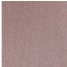
0657-08 ATHENA - PETALE