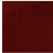
0657-11 ATHENA - ACAJOU