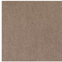
0657-03 ATHENA - SAVANE