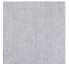
0657-18 ATHENA - CENDRE