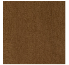
0657-06 ATHENA - BRONZE