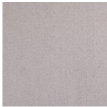
0657-07 ATHENA - POUDRE