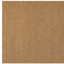
0657-04 ATHENA - MIEL