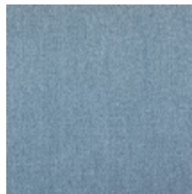
0657-16 ATHENA - ACQUA