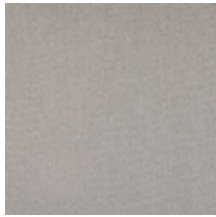
0657-02 ATHENA - BEIGE