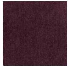
0657-12 ATHENA - BURGUNDY