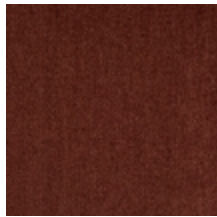
0657-09 ATHENA - BLUSH