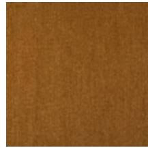
0657-05 ATHENA - ECAILLE