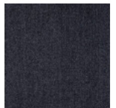
0657-24 ATHENA - ANTHRACITE