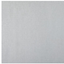
0657-01 ATHENA - ECRU