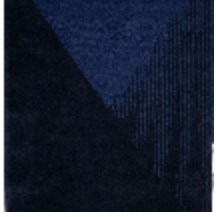
6860-01 TAPIS GLAUKO INDIGO