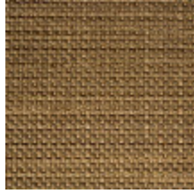
0714-03 HAREM M1 - PAILLE