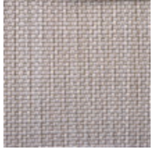
0714-01 HAREM M1 - BLANC