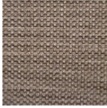
0714-02 HAREM M1 - GREGE