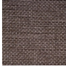
0714-04 HAREM M1 - GRANIT