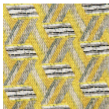
0722-01 TRIBU M1 - CITRON *