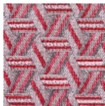
0722-05 TRIBU M1 - SORBET *