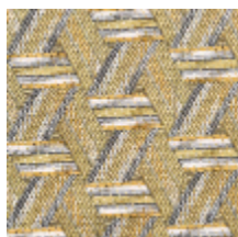
0722-10 TRIBU M1 - PAILLE *