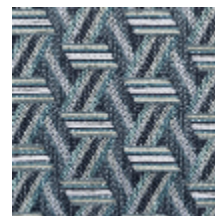
0722-08 TRIBU M1 - LICHEN *