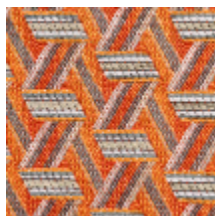
0722-02 TRIBU M1 - ABRICOT *