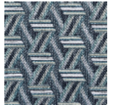
0722-08 TRIBU M1 - LICHEN *