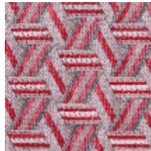
0722-05 TRIBU M1 - SORBET *