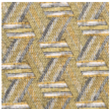
0722-10 TRIBU M1 - PAILLE *