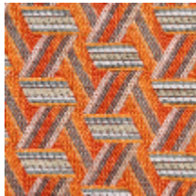
0722-02 TRIBU M1 - ABRICOT *