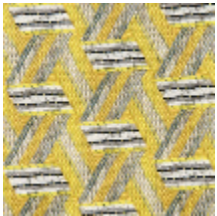
0722-01 TRIBU M1 - CITRON *