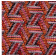
0722-03 TRIBU M1 - CUIVRE *