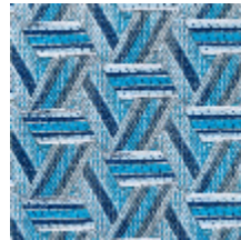
0722-07 TRIBU M1 - CYAN *