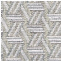
0722-12 TRIBU M1 - NATUREL *