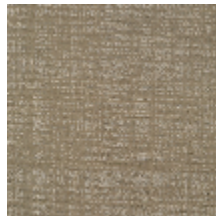
0726-10 PIETRA M1 - VERMEIL