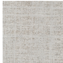
0726-05 PIETRA - MARBRE