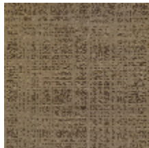
0726-07 PIETRA - OR