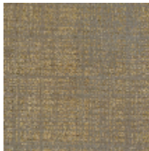
0726-08 PIETRA - PYRITE