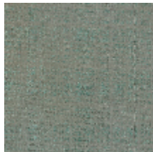
0726-09 PIETRA - ARGILE *