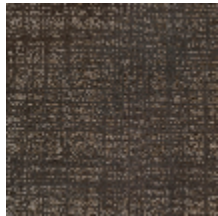
0726-01 PIETRA - TITANE