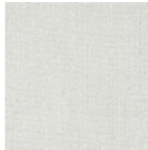
0726-04 PIETRA - CRAIE