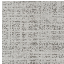
0726-03 PIETRA - PLATINE *