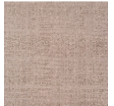
0726-06 PIETRA - POUDRE