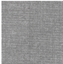
0726-02 PIETRA - ARGENT *