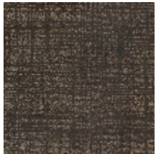
0726-01 PIETRA - TITANE