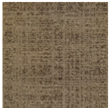
0726-07 PIETRA - OR