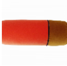
7308-03 RONDIN TUBE COURT CAPUCINE