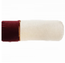
7308-01 RONDIN TUBE COURT GALET