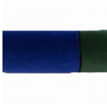
7308-02 RONDIN TUBE COURT NAUTILUS