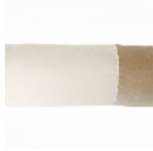
7308-04 RONDIN TUBE COURT SABLE