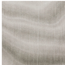
0733-03 CARRIERE MI - QUARTZ