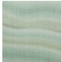
0733-04 CARRIERE MI - JADE