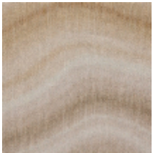
0733-01 CARRIERE MI - ONYX