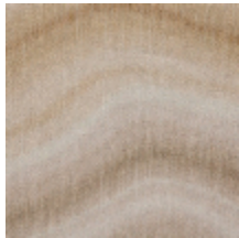
0733-01 CARRIERE MI - ONYX