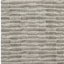
0734-02 FREQUENCE MI - NATUREL