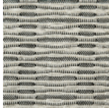
0734-03 FREQUENCE MI - POIVRE