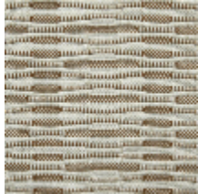
0734-01 FREQUENCE MI - CUIR