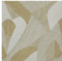
0735-03 TCHIN MI - ECLAT