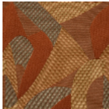
0735-02 TCHIN MI - SOULIER