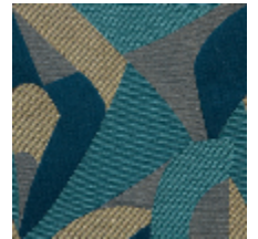
0735-06 TCHIN MI - FOURREAU