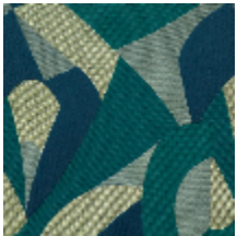
0735-01 TCHIN MI - PARC