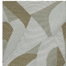
0735-04 TCHIN MI - PALAIS