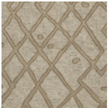
0737-01 SILLON MI - KAOLIN