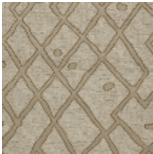
0737-01 SILLON MI - KAOLIN