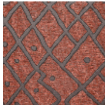
0737-04 SILLON MI - TERRE DE SIENNE