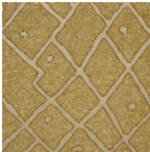
0737-02 SILLON MI - OCHRE