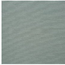
0738-09 PLEINE LUNE - CELADON