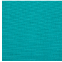
0738-10 PLEINE LUNE - TURQUOISE