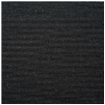
0738-14 PLEINE LUNE - NOIR