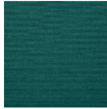
0738-11 PLEINE LUNE - FJORD