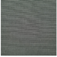
0738-01 PLEINE LUNE - BRUME