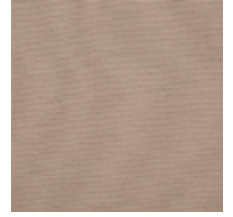
0738-07 PLEINE LUNE - COQUILLE