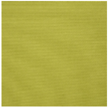
0738-08 PLEINE LUNE - ANIS *