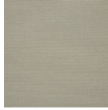
0738-05 PLEINE LUNE - CREME