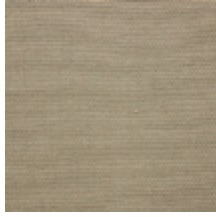
0738-03 PLEINE LUNE - GRES