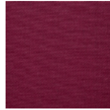
0738-12 PLEINE LUNE - FRAMBOISE *