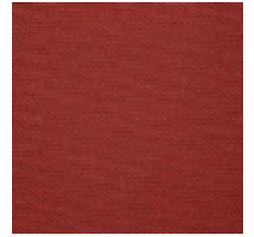
0738-13 PLEINE LUNE - ROUGE *