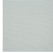
0738-06 PLEINE LUNE - KAOLIN