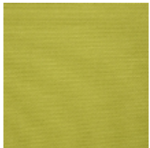
0738-08 PLEINE LUNE - ANIS *