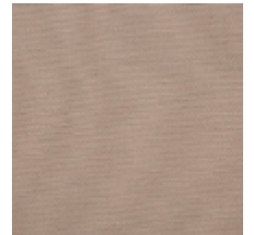
0738-07 PLEINE LUNE - COQUILLE *