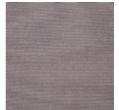
0738-02 PLEINE LUNE - FUMEE *