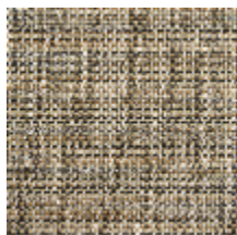
0746-01 MANGROVE MI - CAMEL