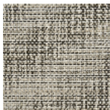
0746-03 MANGROVE MI - POIVRE