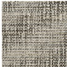
0746-03 MANGROVE MI - POIVRE