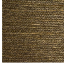
0750-04 COCOA MI - PALME