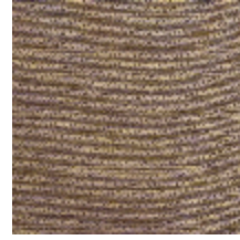
0750-05 COCOA MI - TIARE