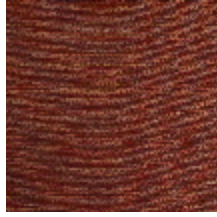
0750-03 COCOA MI - LAQUE