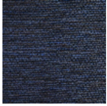
0750-01 COCOA MI - NUIT