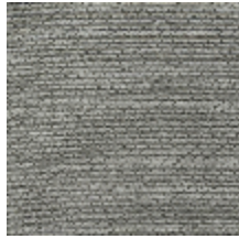
0750-09 COCOA MI - PERLE *