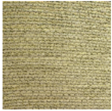
0750-07 COCOA MI - PEPITE